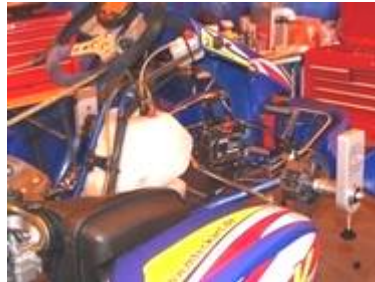
Vermessung der Vorderachse mit Vorderradbremse