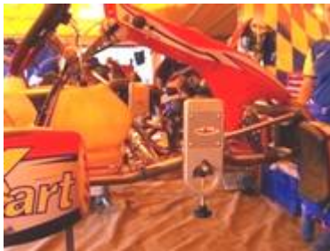
Vermessung der Vorderachse ohne Vorderradbremse