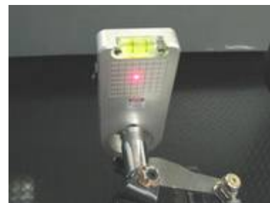
Messkopf zur Kartvermessung