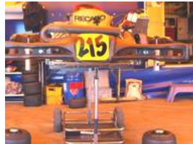
Vermessung der Hinterachse auf Rundlauf